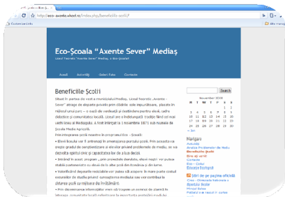
FIGURA 1 IMAGINE DE PE SITE-UL ECO-AXENTE. XHOST.RO