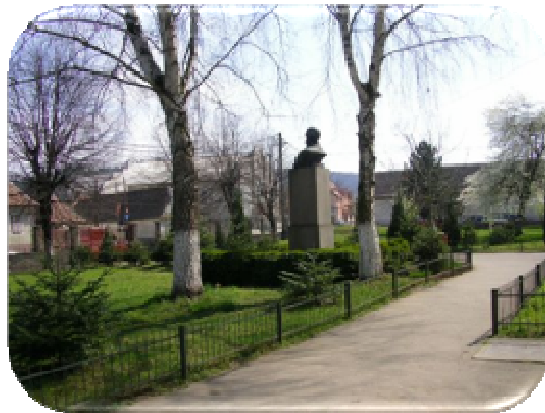
FIGURA 3 CURTEA ȘCOLII

Marca distinctivă a școlii va deveni curățenia : în vederea păstrării curățeniei parcului, precum și a interiorului clădirilor vor fi amplasate mai multe coșuri pentru deșeuri de hârtie și plastic a căror prezență va fi marcată prin afișe.