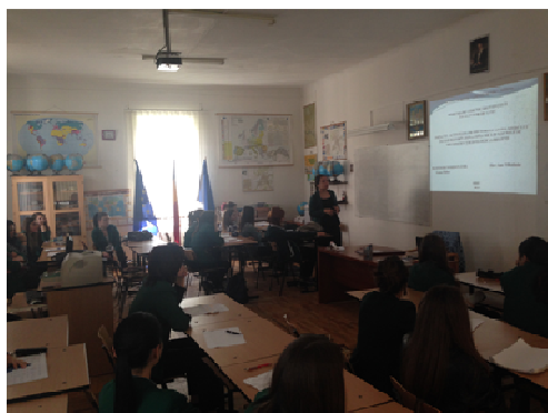
Figura 4 Integrare în curriculum

Integrarea activităților cuprinse în Program se realizează la toate nivelurile activității didactice. La disciplinele amintite deja, predarea de noi cunoștințe poate fructifica la nivelul ilustrării practice diversele aplicații și rezultate presupuse de protejarea mediului ambiant; evaluarea rezultatelor, performanțelor va face posibilă îmbunătățirea întregii activități didactice și motivarea pe termen lung a celor implicați.