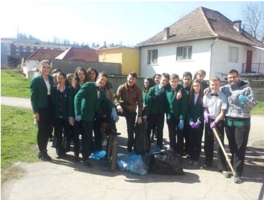
FIGURA 3 GATA DE MUNCĂ!