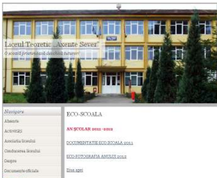
FIGURA 1 IMAGINE DE PE SITE-UL HTTP://AXENTE.RO/