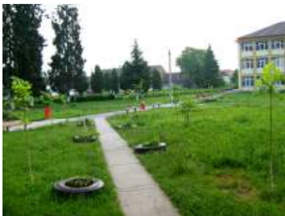
FIGURA 5 CURTEA ȘCOLII

Marca distinctivă a școlii va deveni curățenia : în vederea păstrării curățeniei parcului, precum și a interiorului clădirilor vor fi amplasate mai multe coșuri pentru deșeuri de hârtie și plastic a căror prezență va fi marcată prin afișe.