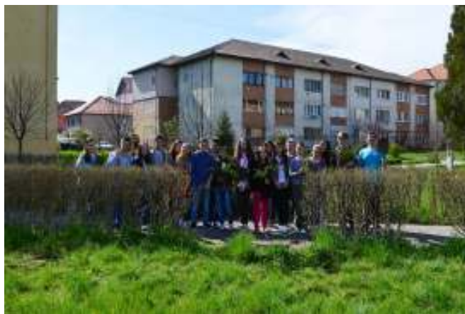
FIG.4 PLANTARE DE PUIEȚI ÎN CURTEA ȘCOLII