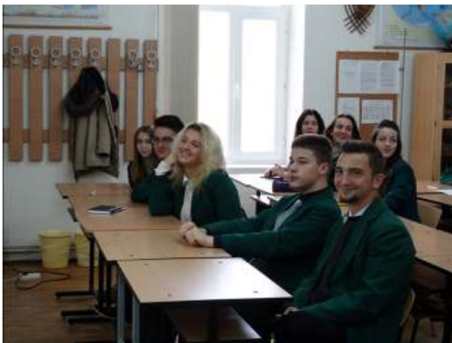
FIG.2 STABILIREA PLANULUI DE ACTIVITĂȚI AN ȘCOLAR 2015-2016