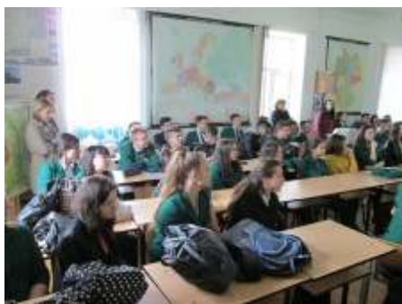
Figura 7 Integrare în curriculum

Integrarea activităților cuprinse în Program se realizează la toate nivelurile activității didactice. La disciplinele amintite deja, predarea de noi cunoștințe poate fructifica la nivelul ilustrării practice diversele aplicații și rezultate presupuse de protejarea mediului ambiant; evaluarea rezultatelor, performanțelor va face posibilă îmbunătățirea întregii activități didactice și motivarea pe termen lung a celor implicați.