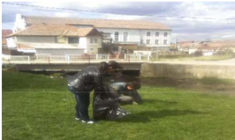
FIG.3 COLECTAREA GUNOAIELOR