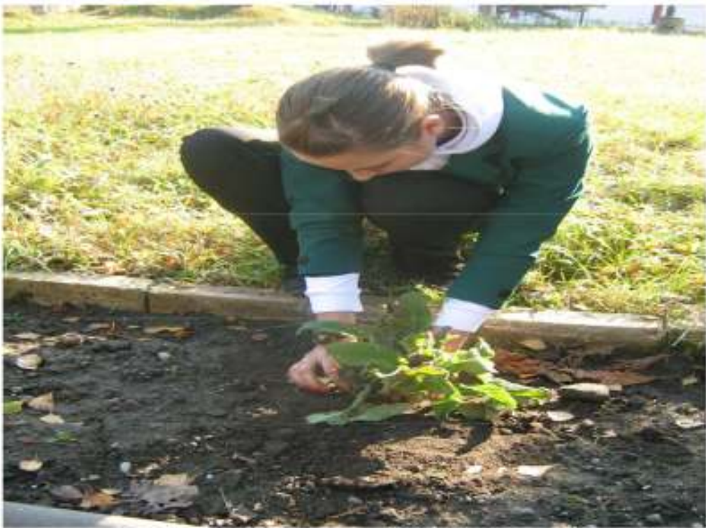
FIGURA 6 GATA DE MUNCĂ!